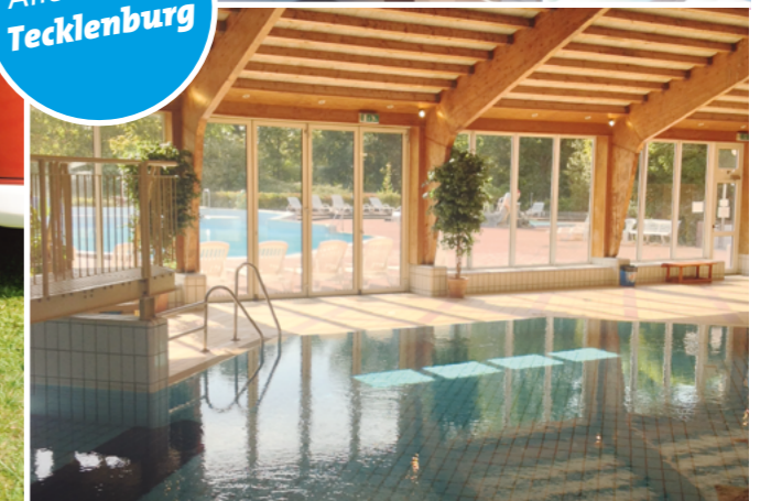
Mehr als 1 Mio. Euro investiert Regenbogen insgesamt, um die Anlage in Tecklenburg zu modernisieren und neu zu strukturieren. Alle Bereiche profitieren davon – und die Gäste ganz besonders.